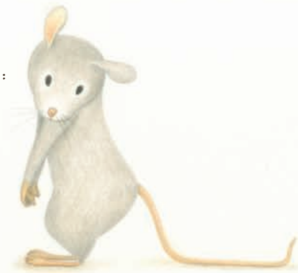
JE HAD DE MUIS MET DE SCHEVE STAART