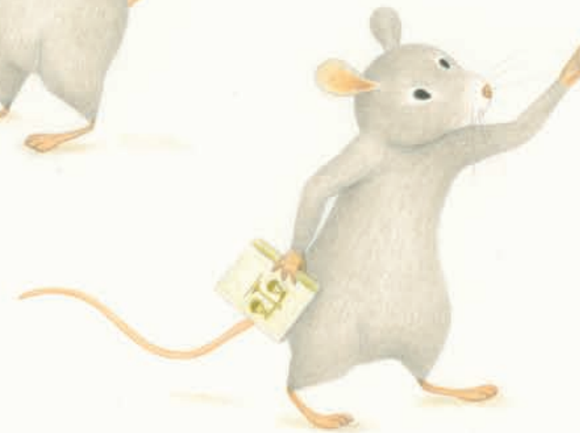
EENTJE DIE STUDEERDE VOOR ADVOCAAAT