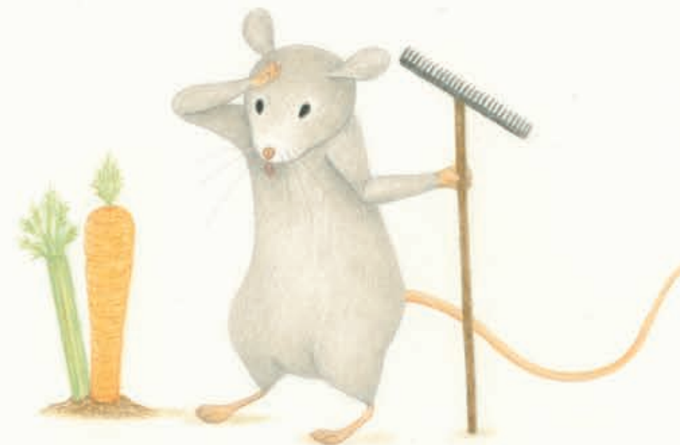
EENTJE MET EEN GROENTETUINTJE