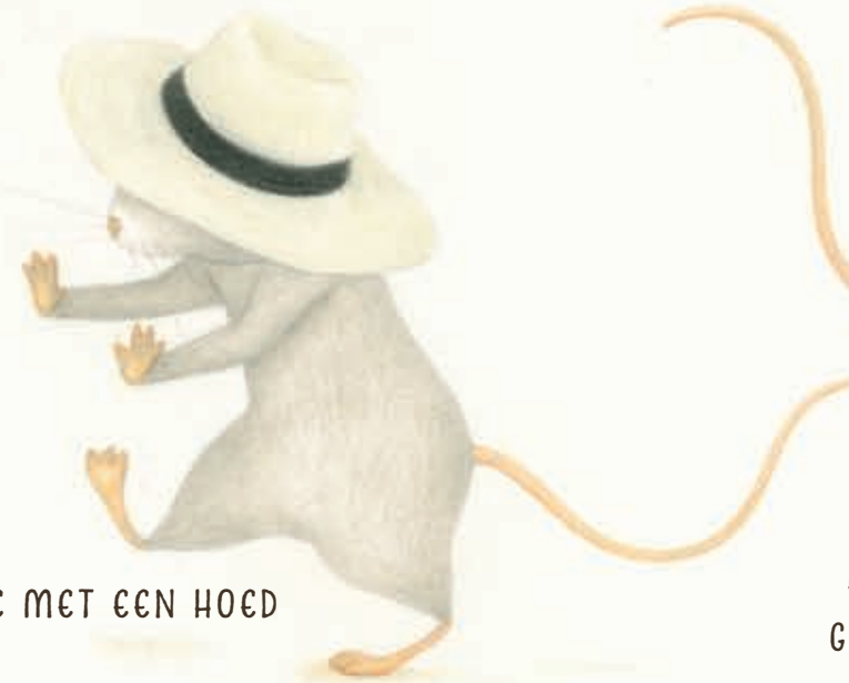
EENTJE MET EEN HOED