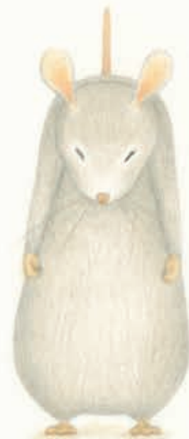
EENTJE MET EEN SLECHT HUMEUR