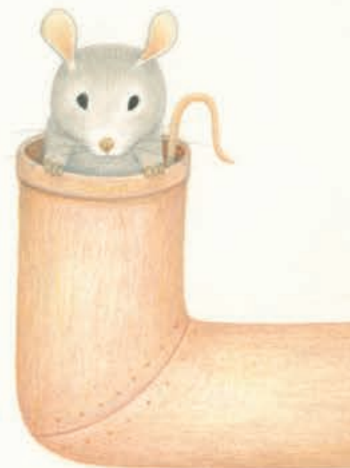
EENTJE DIE IN EEN BUIS WILDE GAAN WONEN