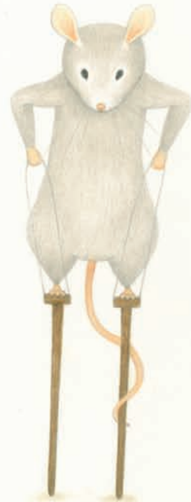
EENTJE ZO EN ZO