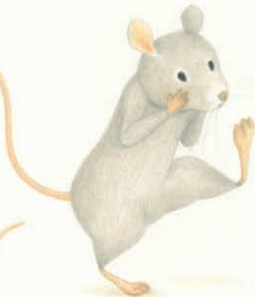
EENTJE WIENS LINKERVOET GROTER WAS DAN DE RECHTER