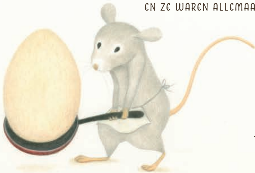
EENTJE DIE EIJEREN KOOKTE

HIJ HAD AL AAN ZOVEEL MUIZEN GEDACHT, EN ZE WAREN ALLEMAAL ANDERS: